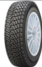
Pirelli Scorpion K4